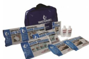
OPATRUNKI WATER JEL