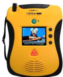
DEFIBRYLATOR AED LIFELINE VIEW