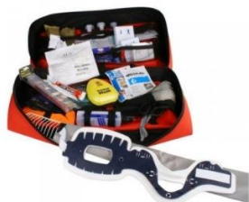
ZESTAW PSP R0