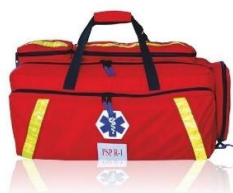
ZESTAW PSP R1

Proponowane ceny są cenami detalicznymi producenta i podlegają negocjacom. Ceny nie zawierają kosztów transportu. Oferta ważna do wyczerpania zapasów.