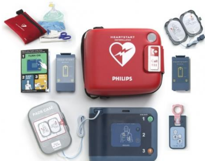
DEFIBRYLATOR AED Philips HeartStart FRx