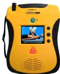
Defibrylator półautomatyczny LIFELINE VIEW PL z dużym wyświetlaczem kolorowym LCD który przedstawia algorytm ERC w pełnym ruchu z pełnowymiarową postacią z 4 letnią baterią

Cena: 4 900,00 zł netto (5 292,00 zł brutto)