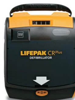
DEFIBRYLATOR AED LIFEPAK CR PLUS