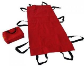
Nosze płachtowe Nr kat. 1805003

Cena: 270,00 zł netto (291,60 zł brutto)