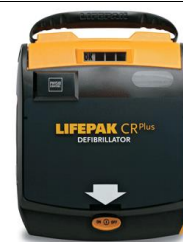
Defibrylator AED LIFEPAK CR PLUS Nr kat. 1816016

Cena: 6 290,00 zł netto (6 793,20 zł brutto)