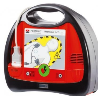
DEFIBRYLATOR HeartSave AED PRIMEDIC