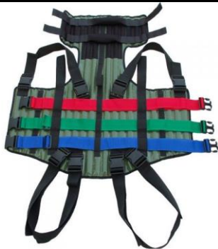
Kamizelka KED unieruchamiająca K.U.K. Nr kat. 1806002

Cena: 1 275,00 zł netto (1 377,00 zł brutto)