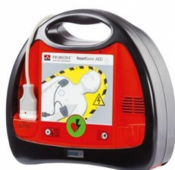
Defibrylator HeartSave AED PRIMEDIC Nr kat. 1816009

Cena: 497,00 zł netto (611,31 zł brutto)