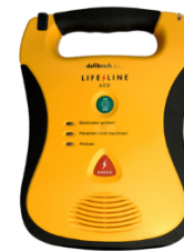
Defibrylator półautomatyczny LIFELINE w wersji z baterią 7 letnią Nr kat. 1816003

Cena: 386,90 zł netto (417,85 zł brutto)