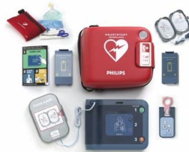
Defibrylator PHILIPS HeartStart FRx zestaw z baterią, elektrodami i zestawem ratowniczym

Cena: 6 700,00 zł netto (7 236,00 zł brutto)